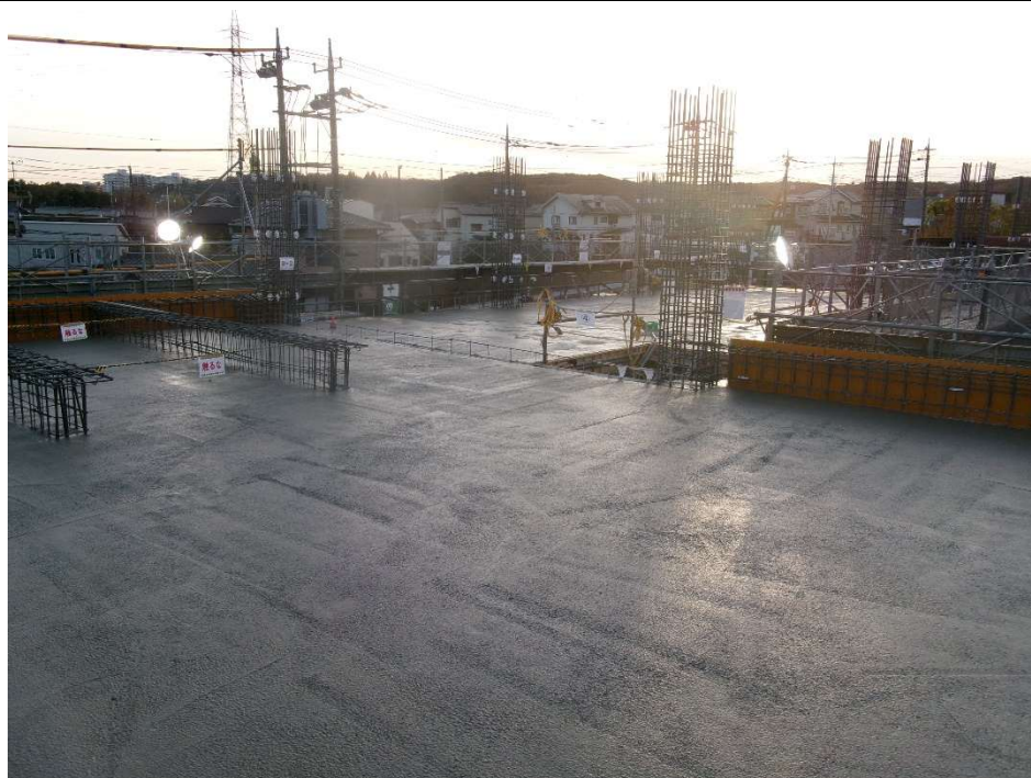
庁舎 北東より撮影【令和7年12月上旬】（2階床コンクリート打設）