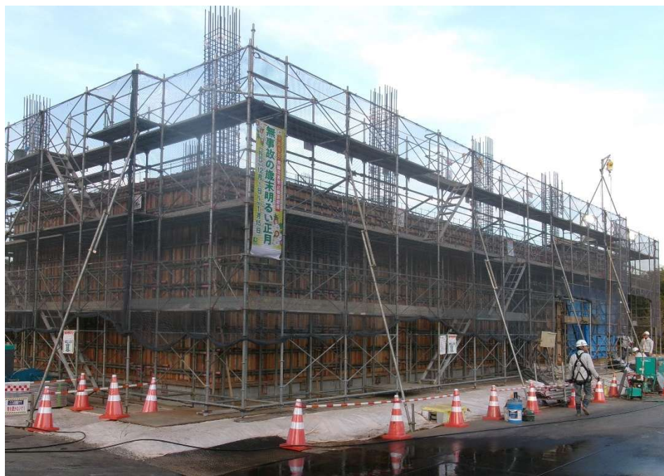
敷地 南西より撮影【令和7年12月上旬】