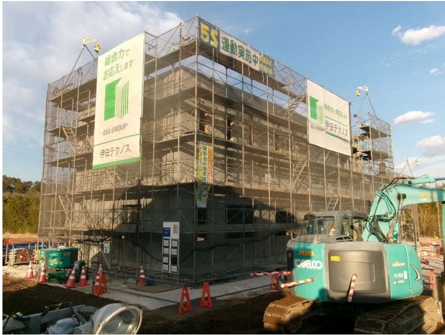
敷地 南西より撮影【令和8年1月上旬】