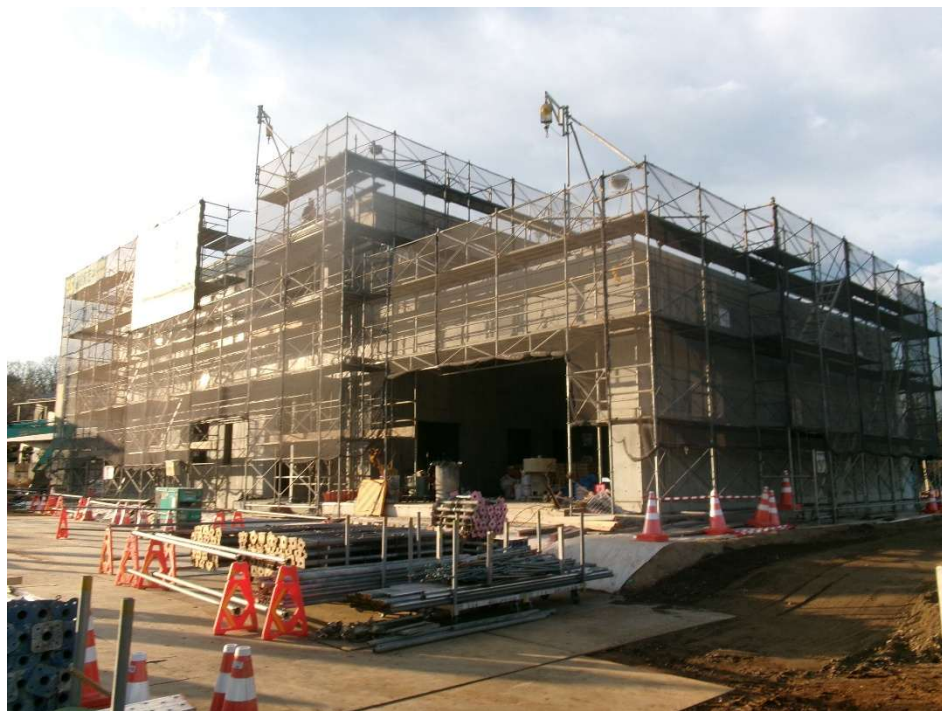
敷地 南東より撮影【令和8年1月上旬】