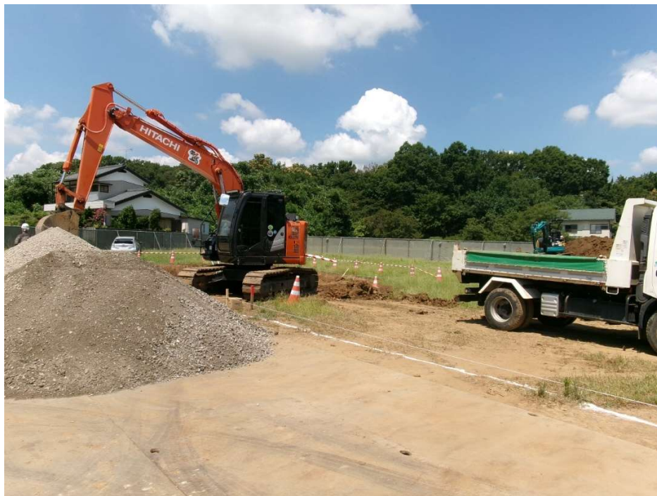
敷地 南東より撮影【令和7年7月下旬】