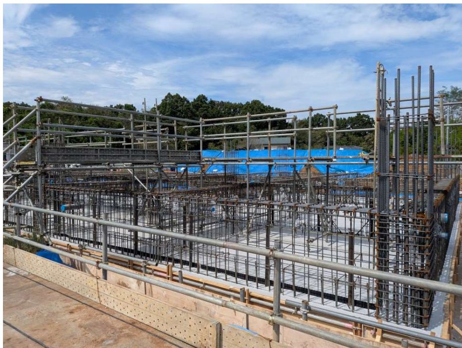
敷地 南東より撮影【令和7年9月下旬】