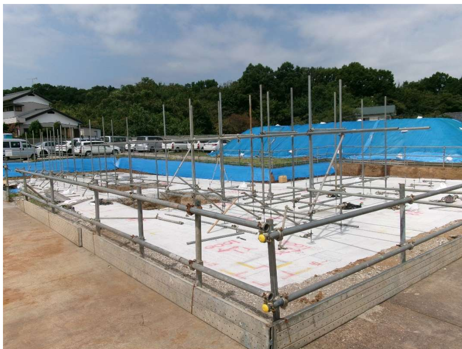
敷地 南東より撮影【令和7年8月下旬】