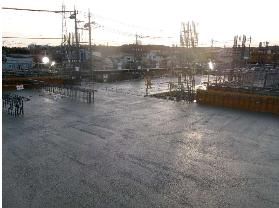
庁舎 北東より撮影【令和7年12月上旬】（2階床コンクリート打設）