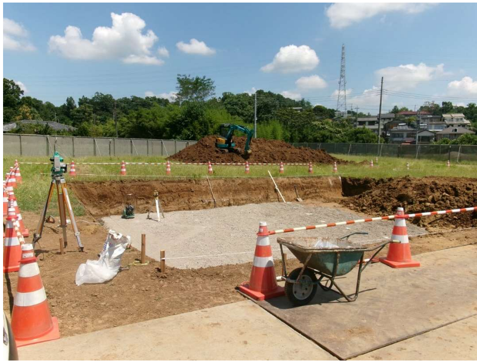
敷地 南西より撮影【令和7年7月下旬】