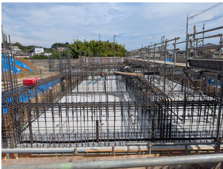
敷地 西より撮影【令和7年9月下旬】