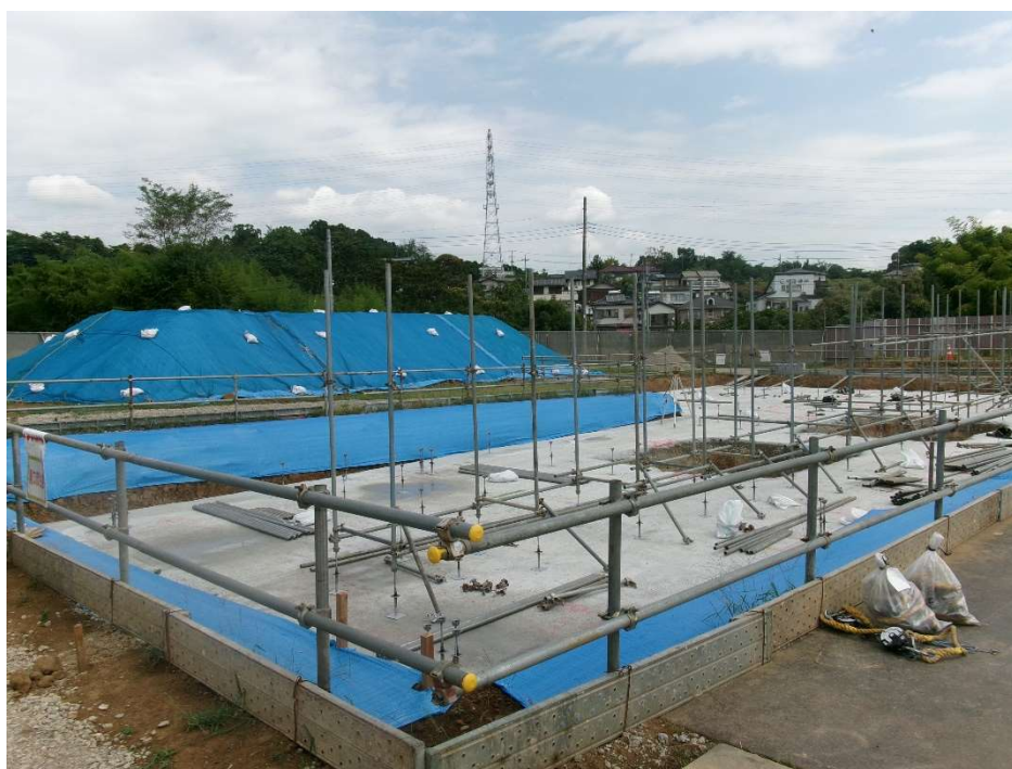
敷地 南西より撮影【令和7年8月下旬】