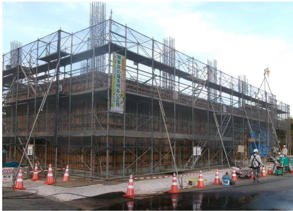
敷地 南西より撮影【令和7年12月上旬】