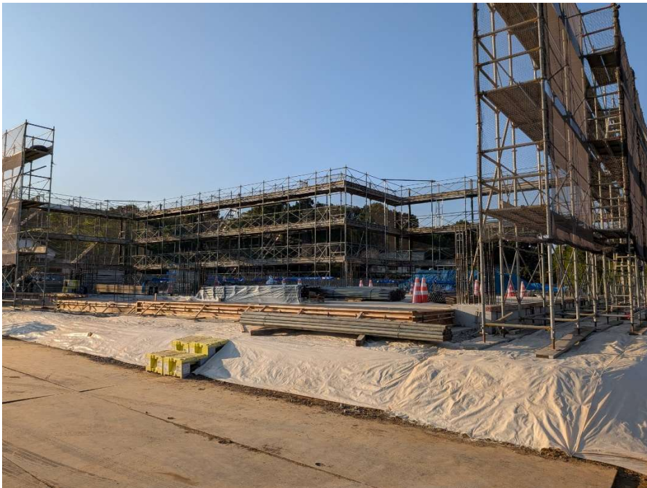
敷地 南東より撮影【令和7年10月下旬】